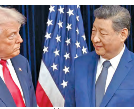
అమెరికా అధ్యక్షుడు డోనాల్డ్ ట్రంప్ (ఎడమ) చైనా అధ్యక్షుడు షి జిన్ పింగ్ (కుడి) తో కలిసి ఉన్నట్లు తెలుస్తుంది.

మీడియా సంస్థలు తమపై నిరాధార ఆరోపణలతో కథనాలు ప్రసారం చేస్తున్నాయని విమ ర్శించింది. అయితే చైనా నుంచి ఆయు ధాలు అందించడం ఇరాన్ బహిష్కరించగల వెల్లడించింది. కానీ, తాము అమెరికా విమానాలను విజయవంతంగా కూల్చి దానికీ చైనా ఆయుధాలను వాడలేదని, తమ ఆధునాతన రక్షణ వ్యవస్థలే యూఎస్ విమానాలను కూల్చానని ఉపయోగపడ్డాయని ఇఆర్ జీసీ వెల్లడించింది. భుజం మీద పెట్టుకొని ప్రయోగించే షార్ట్ రేంజ్ మిస్సైల్ లాంచర్లను, ఇతర ఆవి టెక్నోలజీ చేరే అవకాశం ఉందని అమెరికా డిఫెన్స్ వ్యవస్థలను సరఫరాచేస్తున్నదని, వారం రోజుల్లో వరల్డు గగ్గెలు పెట్టాయి.